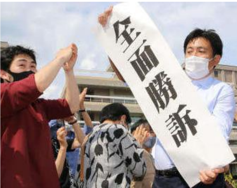
2020年7月14日、広島高裁での全面勝訴判決を喜ぶ人たち

県・市の実態調査(08~10年)でも「黒い雨」は宇田雨域の4~5倍降ったと発表、政府に区域拡大を要望した。しかし政府は10年12月に検討会を発足させたものの、厚労相諮問機関「原爆被害者対策基本問題懇談会」(基本懇)の「被曝地域指定は科学的合理的根拠に基づいて行われるべき」との1980年答申を盾に、2012年区域拡大を拒否した。