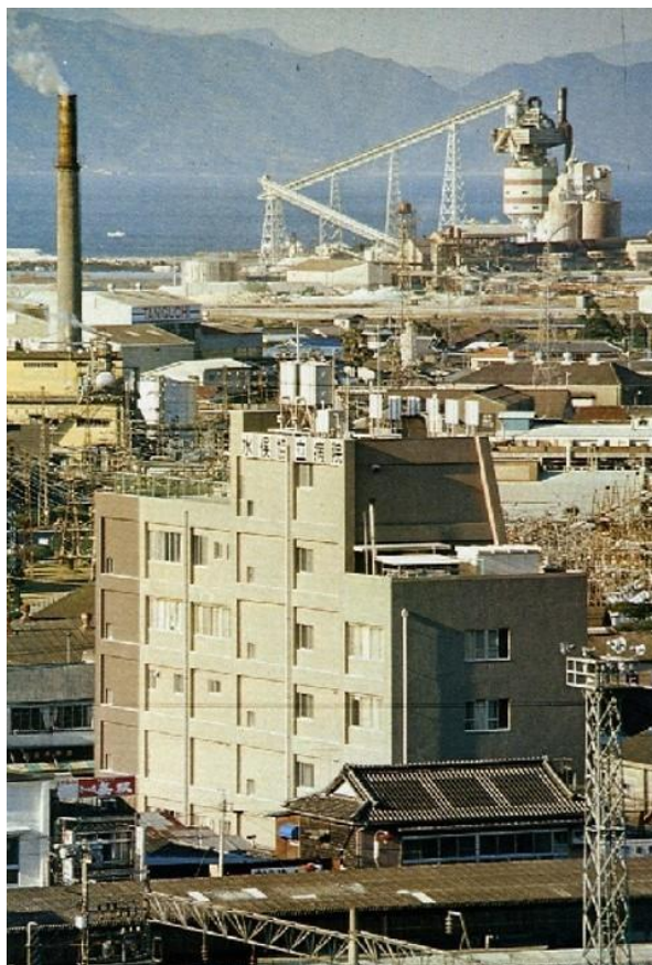
1978年、チッソ水俣工場前に設立された水俣協立病院。手前は当時の水俣駅

水俣病は主として神経系が障害される疾患であるため、私は神経内科の研鑽を積むことを目的に、1991年から2年間、東京都文京区の順天堂大学脳神経内科で研修を受けました。そこでは、パーキンソン病などの変性疾患、脳血管障害、腫瘍性疾患、脱髄疾患、筋疾患、髄膜炎、膠原病に伴う神経障害など、数多くの神経疾患の診療を経験することができました。神経内科では、神経系の各機能をみる診察所見の種類が数多くあります。そのため、個別鑑別診断が重視され、ある疾患を疑った時も、同様症候を示す他疾患の存在によって当該疾患を否定するという手法がとられていまし